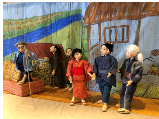
「へっこきよめさま」の一場面

しゅくだい、ぼうさまになったカラス、なきむし茂次郎、備前長船刀かじ誕生ものがたり、あーちゃんとカースケ、ゆらゆら橋の上で、えがおとえがお、ともだち、クロとあっこちゃん、へっこきよめさま