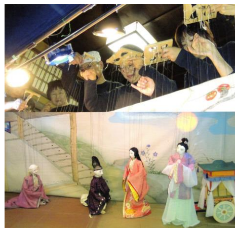
アマチュア人形劇団の上演風景

喜之助人形劇フェスタは、瀬戸内市中央公民館を主会場に、瀬戸内市民図書館の「つどいのへや(喜之助シアター)」も会場となって開催されます。プロ劇団やアマチュアの劇団などがさまざまな人形劇を上演します。