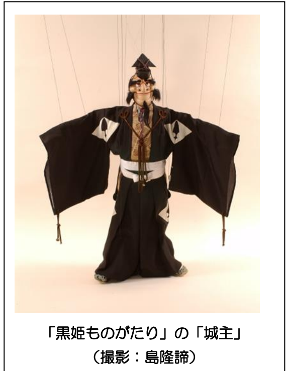
「黒姫ものがたり」の「城主」