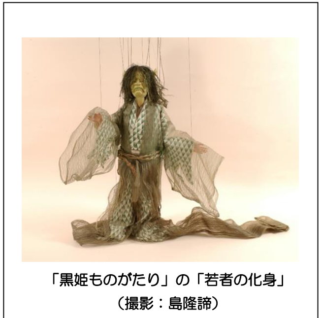
「黒姫ものがたり」の「若者の化身」