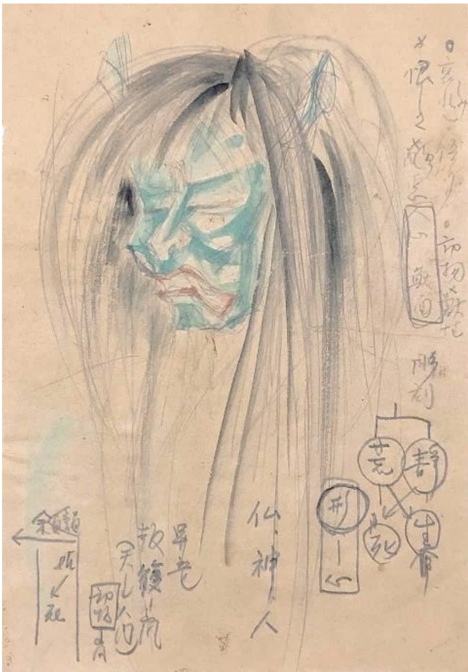
デザイン画・制作メモ（若者の化身）